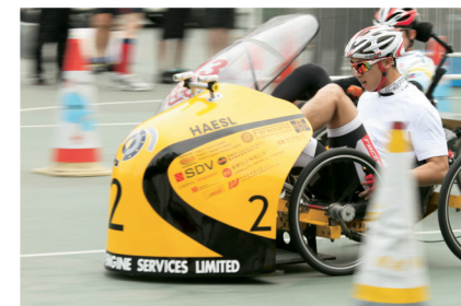
慈善腳踏車格蘭披治大賽

2012年，港發獲播道兒童之家提名為「商界展關懷」成員，肯定了我們對本地社區的貢獻。多年來，港發致力支持附近地區（包括九龍東）青年人的發展，藉此分享我們在社會、經濟和環境方面的價值觀念。